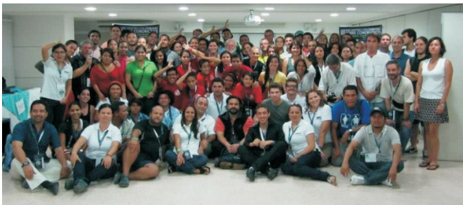
III Encuentro, Santa Marta, 2012