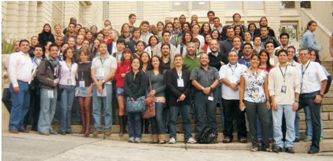
I Encuentro, Bogotá, 2008

El Encuentro Colombiano sobre Condrictios (ECC) es un espacio de divulgación de conocimiento e interacción entre los investigadores interesados en ese grupo de peces tanto en Colombia como en América Latina.