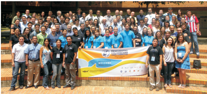
II Encuentro, Cali, 2010

Esperamos la participación de todos y cada uno de ustedes, y que puedan disfrutar de un Encuentro Colombiano sobre Condrictios de gran calidad logística, académica y científica en pro de la conservación de tiburones, rayas y quimeras, no sólo en Colombia, sino en América Latina.